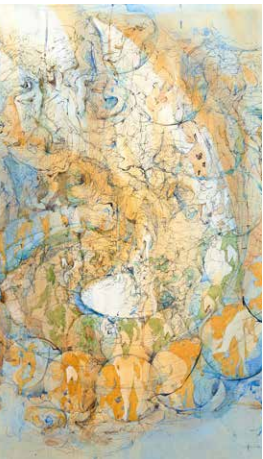
ドローイング・大洪水の予感 (部分) 2007 年