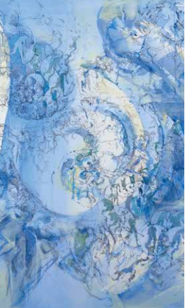
ドローイング・大洪水(部分) 2009 年