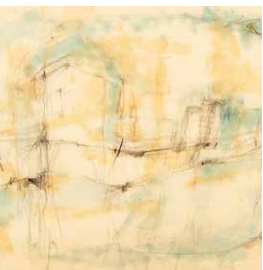
建物・反建物・めぐり(部分) 1958 年