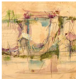
建物・反建物・めぐり (部分) 1958 年