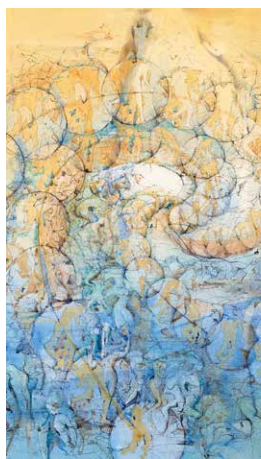
ドローイング・大洪水の予感 (部分) 2007 年