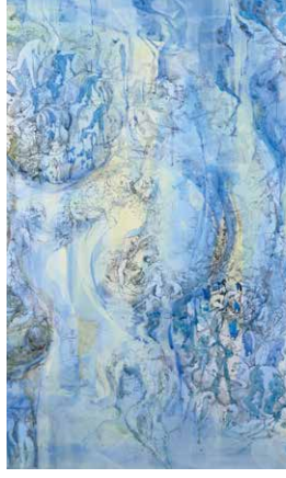
ドローイング・大洪水 No.3 (部分) 2009 年